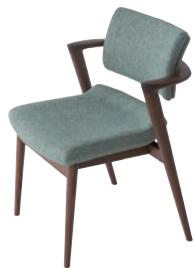
KX250AU / WA