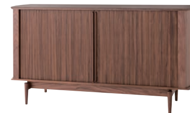
KX566U / WA

塗色：ホワイトオーク / ポリウレタン樹脂塗装(*1) ビーチ / ポリウレタン樹脂塗装(*1) ウォールナット / ポリウレタン樹脂塗装 *塗色・張り布について詳しくは、弊社WEBサイト、または店頭でのサンプルにてご確認ください。 *ポリウレタン樹脂塗装のあとに(*1)と記載されている商品は15%アップの価格でオイル仕上げにも対応しています。