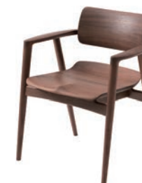
KX261AU / WA