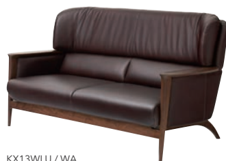
KX13WLU / WA