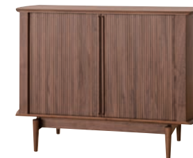
KX561U / WA