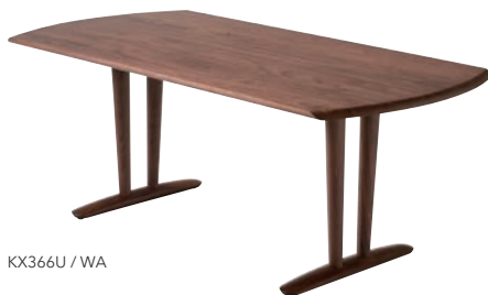
KX366U / WA