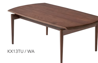
KX13TU / WA

塗色: ホワイトオーク / ポリウレタン樹脂塗装(*1) ビーチ / ポリウレタン樹脂塗装(*1) ウォルナット / ポリウレタン樹脂塗装 ※KX251A・KX261Aのみオイル仕上げは承れません。