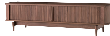
KX554U / WA