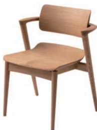
KX251AN / OU