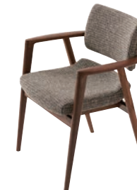
KX260AU / WA