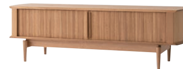
KX552N / OU