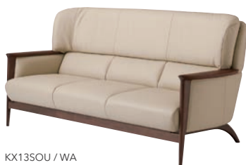
KX13SOU / WA