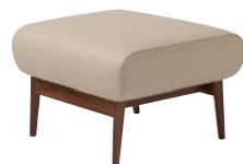
KX13SU / WA