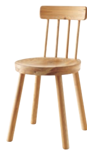
EM200 / NY2