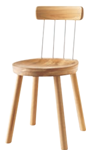
EM201 / NY2

チェア (Po) W40.5×D47.5×H80.5 SH43 EM202 スギ(圧縮板目材・節入り) / スチール ¥55,000 (税別)