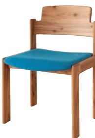
KC201 / NY2