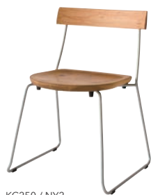
KC250 / NY2