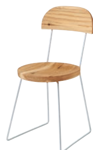
EM202 / NY2