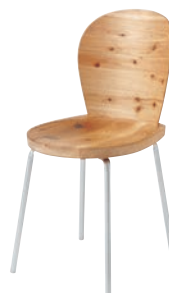
EM204 / NY2

スタッキングチェア W49.5×D48×H71.5 SH41.5 KC250 スギ(圧縮板目材・節入り) / スチール ¥50,000 (税別)