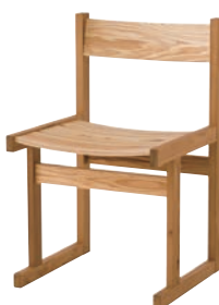
JS201 / NY2